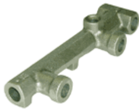
メーターユニット(ガス)

割面方向で寸法公差が0.8。以前は加工で調整してセンター穴はゲージにて寸法を合わせました。タップ たものが、加工レスです。