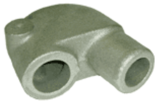
ミキシングエルボ(エンジン部品)

袋形状のため、ガス欠陥を防ぐのがポイント。中子砂油圧部品のため、巣が出来ないように注意。とガス抜きでガス欠陥を防ぎました。