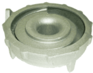
コンプレッサハウジング