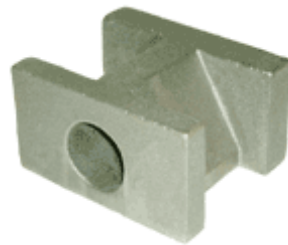
シリンダー(工作機械)

油穴が外・中に貫通しています。穴位置の固定と穴に芯が細さ 10m/m なので、焼き付かないよう塗装し 砂・バリが残らないよう注意しました。