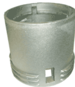
上部枠(マンホール)